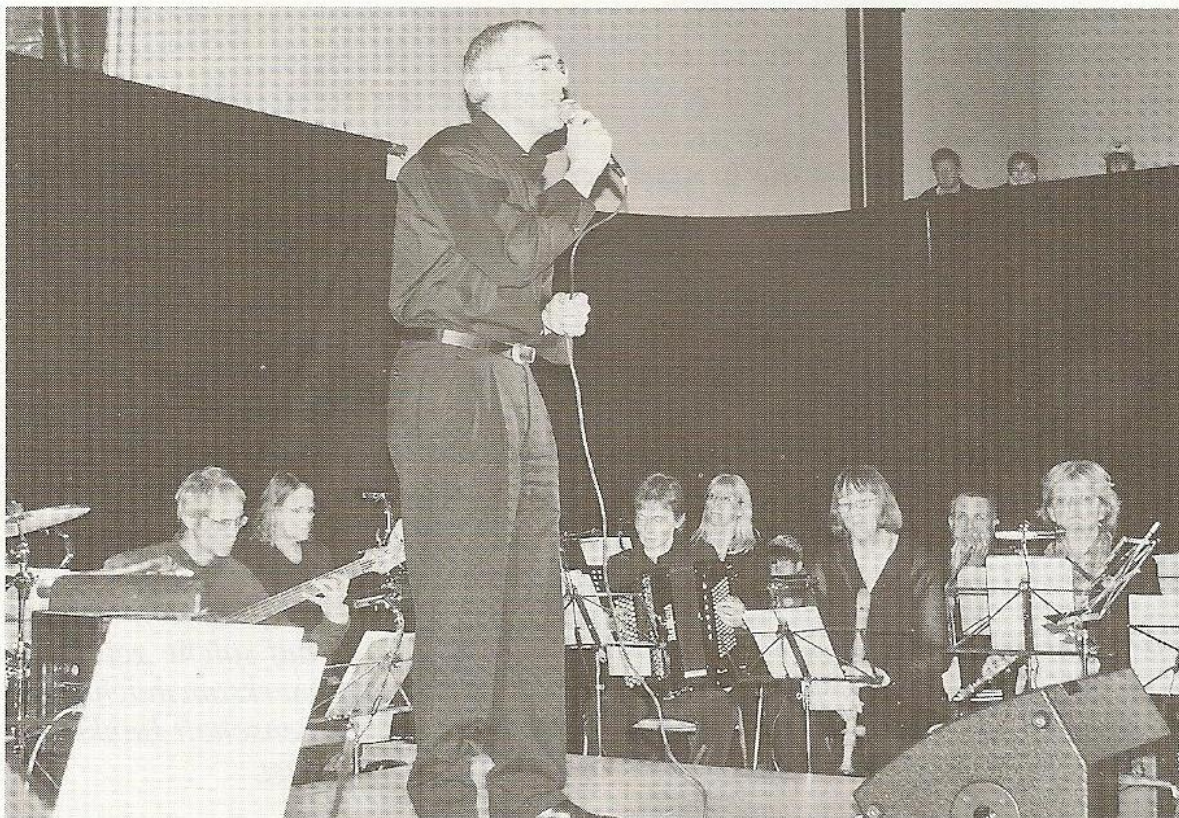
Den ersten Programmteil bestritt eine Kleinformaion mit eher klassischen Instrumenten.

Die Musikschulen Prättigau, Gagnef und Hünstetten arbeiten seit sieben Jahren eng zusammen. Gemeinsame Projekte, Konzertreisen und Schüleraustausche sind die Folge davon. Auch die «european ms factory big band» ist aus diesem Kontakt entstanden.