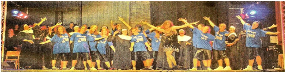
Von der Begeisterung der Akteure liess sich das Publikum anstecken.