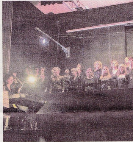
Der stimmungsgewaltige Chor begeisterte.