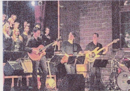
Die «MSP Factory Group GmbH» spielte souverän.