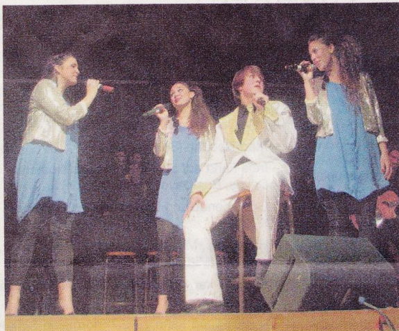
Munteres Gesangsquartett aus Schweden und dem Prättigau.